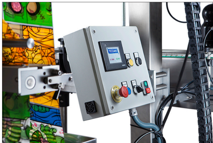
Pantalla táctil y pulsadores independientes del armario principal (opcional)